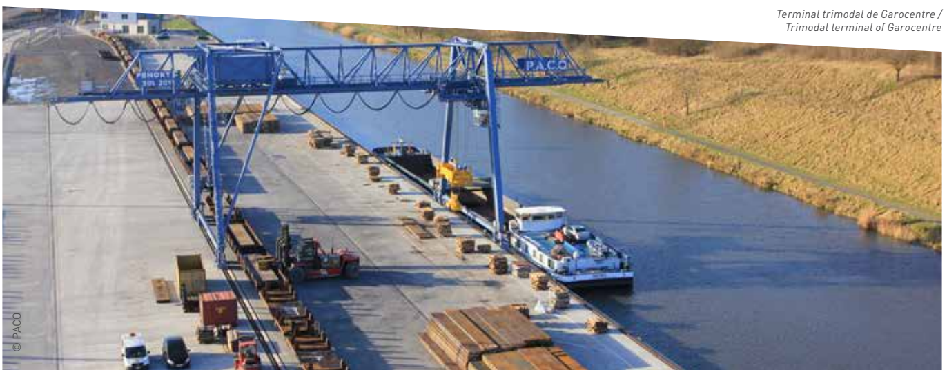
Terminal trimodal de Garocentre / Trimodal terminal of Garocentre